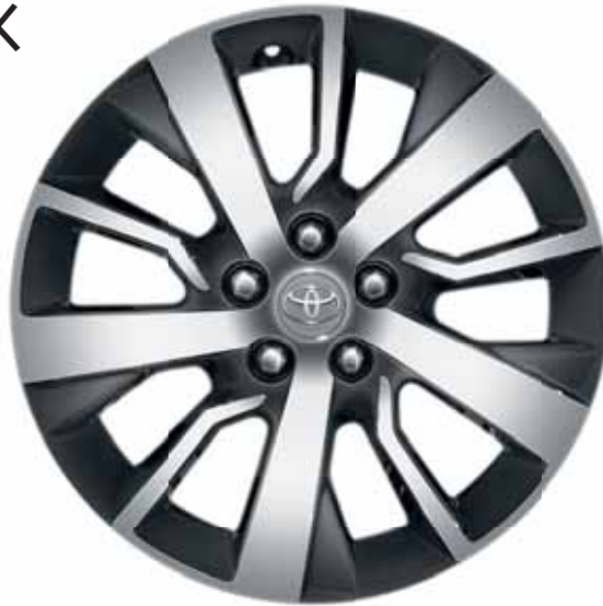
17" könnyűfém keréktárcsa, 5 íkerküllős, sötétszürke, csiszolt felületű

A szív által diktált és az észszerű választás egyszerre. A Toyota tartozékai, például a küszöbcső és könnyűfém keréktárcsák további stílust kölcsönöznek járművének, amely maradandó emléket hagy maga után mindenütt, ahol csak megfordul. A praktikus parkolórendszer, lökhárítóvédő és szőnyegek járműve újszerű megjelenésének megőrzéséről gondoskodnak.